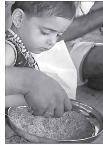
രാവിലെ 4.30 ന്