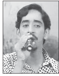
ശ്രീ. രാഹുൽ ലക്ഷ്മൺ Asianet Star Singer fame